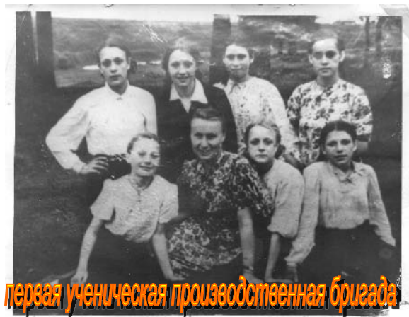
первая ученическая производственная бригада

В честь сорокалетия пионерской организации 2 октября 1960 года был дан старт пионерской двухлетке, под девизом «Пионеры – Родине». Пионеры тогда собрали 500 тонн металлолома и 500 килограммов макулатуры.